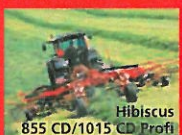
Hibiscus 855 CD/1015 CD Profi

Vender fra 3 til 15 m. Luffig og perfekt vending med den UNIKKE vende tand. Lely Lotus giver dig 30% højere kapacitet. Forskellen tæler for sig selv.