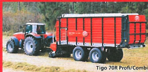
Tigo 70R Profi/Combi